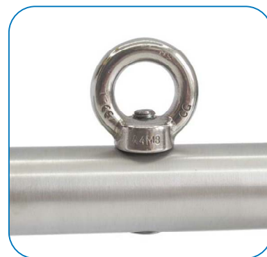
La poignée de préhension du 50kg est équipée d'un crochet. Handle for 50kg weight is equipped with a hook