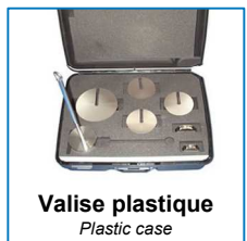
Valise plastique Plastic case