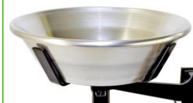
Plateau « Maraichers » « Maraichers » panscale