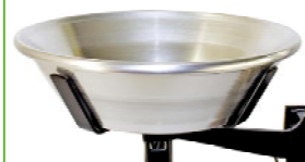
Plateau « Maraichers » « Maraichers » panscale